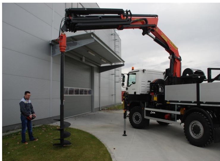
ŻURAW W POZYCJI ROBOCZEJ ZE ŚWIDREM ZIEMNYM