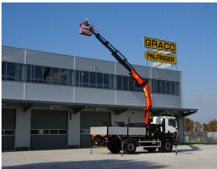
ŻURAW W W POZYCJI ROBOCZEJ Z KOSZEM ROBOCZYM