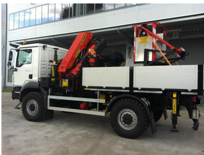
ŻURAW W POZYCJI TRANSPORTOWEJ