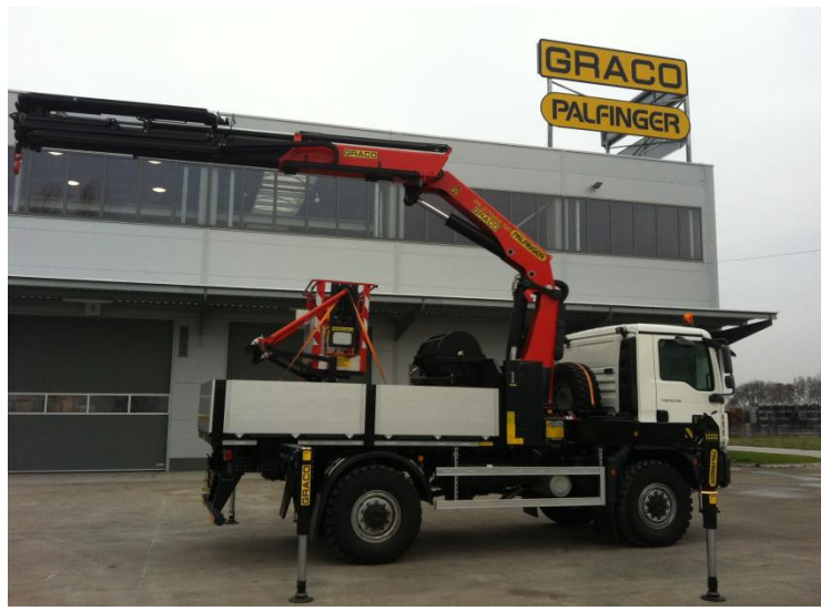
ŻURAW W POZYCJI ROBOCZEJ Z HAKIEM ŁADUNKOWYM